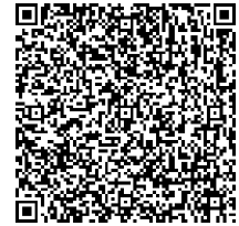
小松空港オンラインショップ QRコード