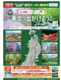
ご案内チラシ(イメージ)