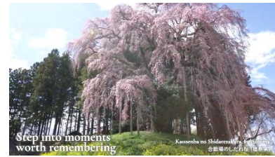
東北の広域観光動画(イメージ)