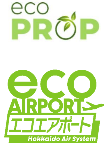
“eco PROP” がデザインされたATR42-600型機(4号機)と