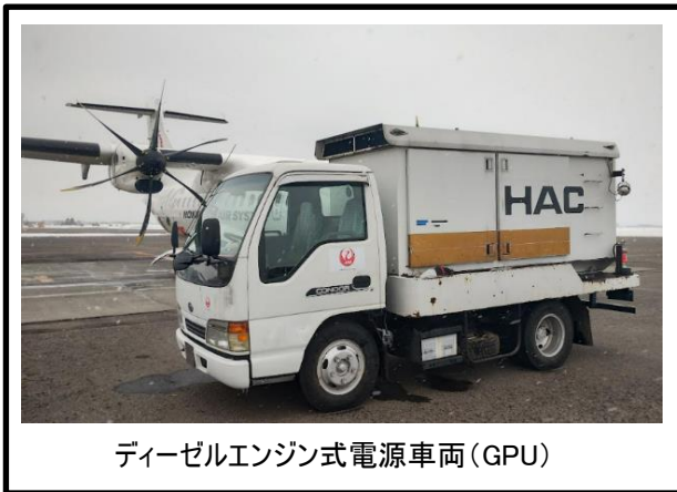
ディーゼルエンジン式電源車両 (GPU)

駐機中の航空機への電力供給と空調は、ディーゼルエンジン式の電源車両「GPU」を使用して行われており、排気ガスおよびCO2が発生しています。新たにバッテリー式の「eGPU」を導入することで、低騒音化やCO2排出量の削減、省エネ化を実現することが可能になりました。