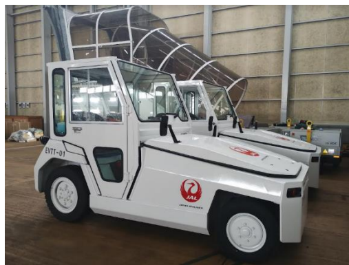
EVトーイングトラクターのルーフは北海道の冬を想定した仕様となっている