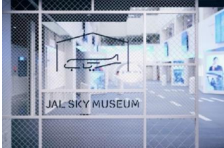
JAL SKY MUSEUM