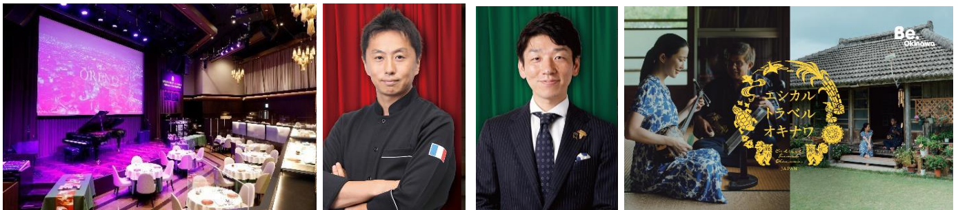
「俺のフレンチ グランメゾン 大手町」

JALグループは、今後も地域との連携を一層強化し、地域の活性化に積極的に取り組んでまいります。