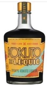
KOKUTO DE LEQUIO

*2022年11月21日付プレスリリース「 JALと俺の株式会社がコラボレーション、「食」を通じて地域への誘客を実現する取り組みを開始 」