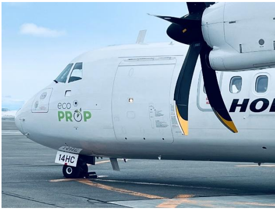
「eco PROP」ロゴを施した4号機(JA14HC)

HACが運航するeco PROP、ATR42-600型機は、そのサイズ感や徹底した軽量化により低燃費で運航することが可能な航空機です(*4)。また、高翼機のため全座席から均等に窓下の景色がご覧いただけ、かつジェット機よりも低い高度を運航するため、間近に北海道・北東北の雄大な景色を感じ、環境保全の大切さを体感いただくことができます。自然にやさしく、環境意識を高められる移動手段として、この冬、ぜひご活用ください。