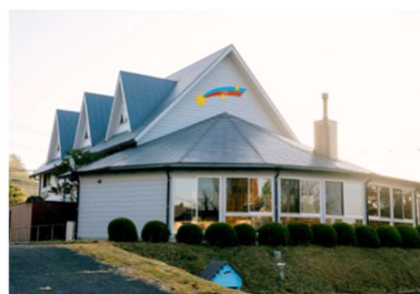
星空ペンションコメント