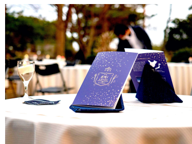
レストランイメージ