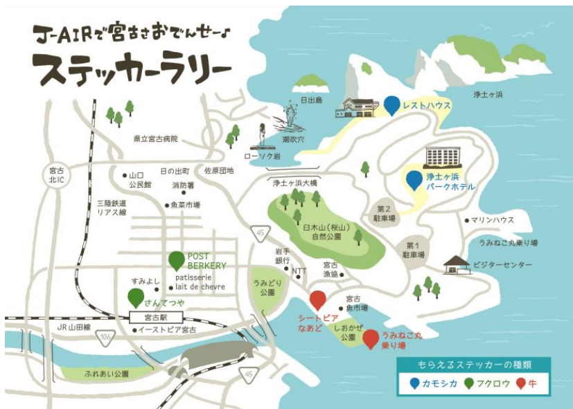
応募用紙(キャンペーンマップ)(イメージ)