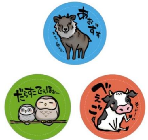
ステッカー(イメージ)