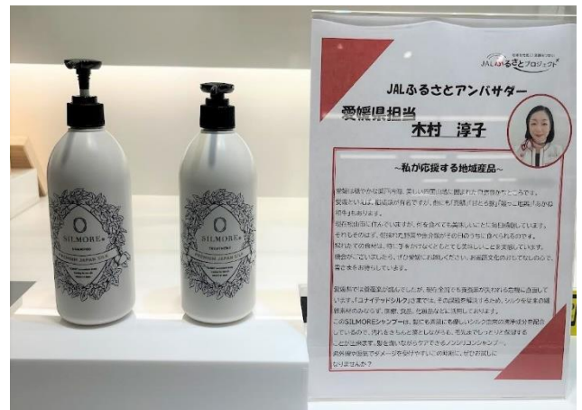
「JALふるさとアンバサダー」お勧めの地域商品展示の様子(一例)