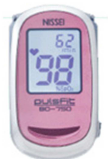
パルスオキシメーター

( https://www.jal.co.jp/jalpri/equipment/plane.html )