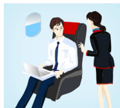
客室乗務員がご登録いただいた医師の方のお座席へ援助依頼。