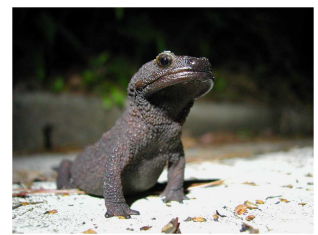
イボイモリ