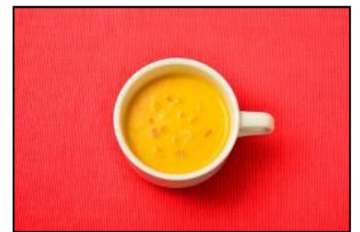
万次郎かぼちゃスープ