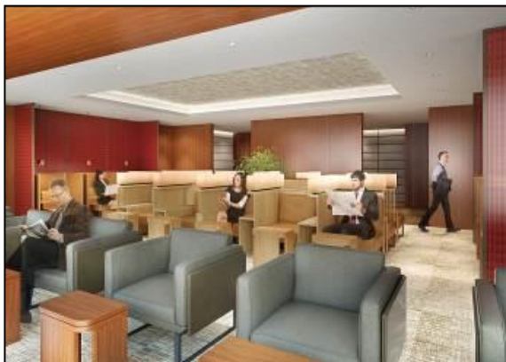
ダイヤモンド・プレミアラウンジ (イメージ)

※2 1960年 東京都生まれ。武蔵野美術大学造形学部建築学科卒業後、株式会社乃村工藝社入社。現、商環境事業品部A.N.D.クリエイティブディレクター。“クライアントの思いを魅力的なカタチに落とし込むこと”をモットーに数多くの飲食店をデザインするほか、マンダリン オリエンタル東京のメインダイニング、新丸ビル の環境デザインなど活躍の場は多岐にわたる。