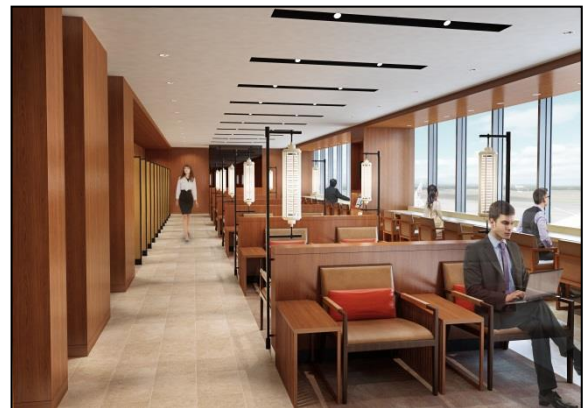
サクララウンジ (イメージ)