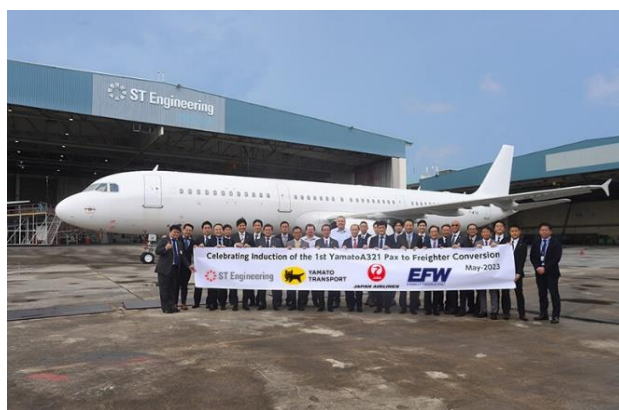
<機体改修着手を記念した関係者集合写真>