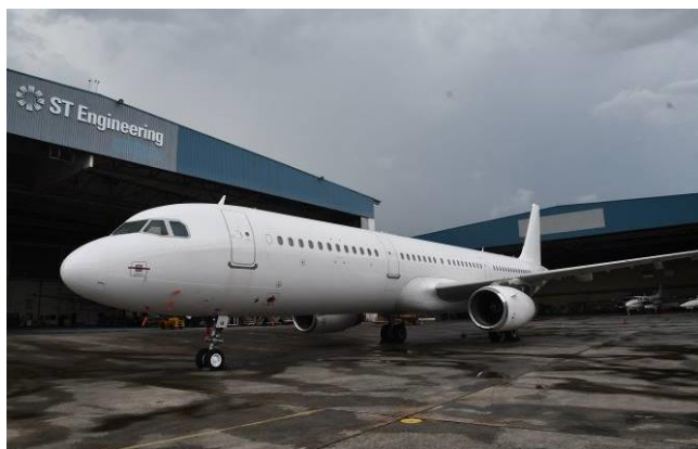
<機体改修前の1号機(MSN4173)>

2023年5月8日(月)から、シンガポールのSTエンジニアリング社にて、1機目の改修を開始しました。