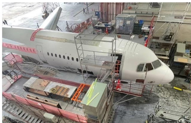
<格納庫に機体が格納された様子>