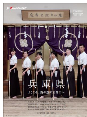
機内誌特集記事(イメージ)