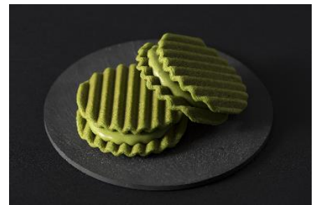
「抹茶幻月」(然花抄院)