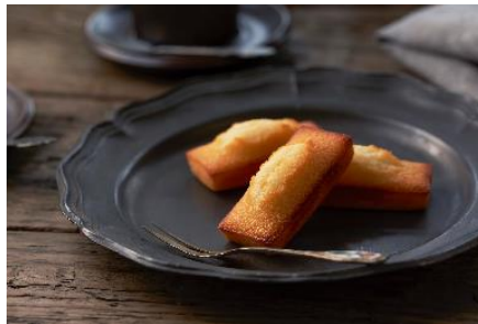
「フィナンシェ」(アンリ・シャルパンティエ)