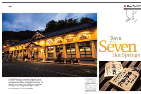
機内誌英文特集記事(イメージ)