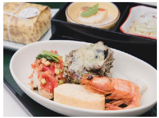
機内食メニュー(中旬羽田着・下旬羽田発)