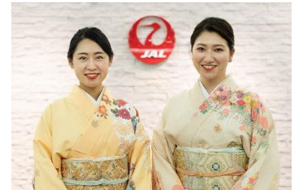
着物を着用した客室乗務員(イメージ)

二. フライト中、全 7 シーンにて、「ONE PIECE」の主要キャラクターである”麦わらの一味”の特別なアナウンスをお楽しみいただけます。また、”ワノ国”の世界観をイメージし、着物を着用した客室乗務員がお出迎えし、搭乗前の記念撮影スポットや機内にておもてなしをします。その他、アニメ映像や音楽の放送、「ONE PIECE」の知識を問うクイズ大会、機内装飾など、作品の世界観を楽しめるコンテンツをご用意しています。