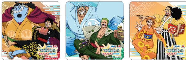
コースター(イメージ)

三. 当チャーターのために描き下ろされたイラストを使用した限定グッズ(コースター、トートバッグ、ステッカー、搭乗証明書)に加えて、集英社週刊少年ジャンプ編集部に眠る「ONE PIECE」グッズやスナックなどをお土産としてご提供します。