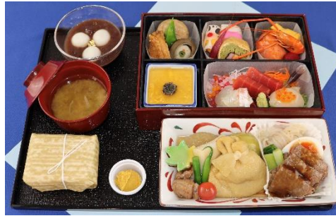
ビジネスクラス(和食)(イメージ)