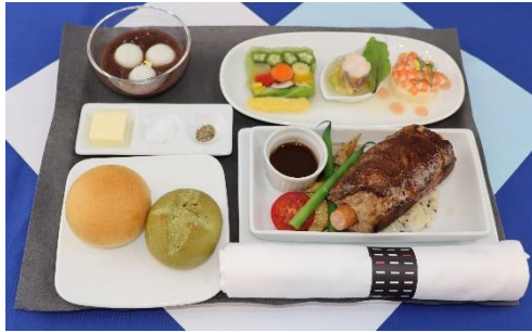
ビジネスクラス(洋食)(イメージ)