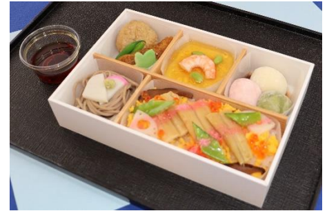
エコミークラス(イメージ)

二. フライト中、全 7 シーンにて、「ONE PIECE」の主要キャラクターである”麦わらの一味”の特別なアナウンスをお楽しみいただけます。また、”ワノ国”の世界観をイメージし、着物を着用した客室乗務員がお出迎えし、搭乗前の記念撮影スポットや機内にておもてなしをします。その他、アニメ映像や音楽の放送、「ONE PIECE」の知識を問うクイズ大会、機内装飾など、作品の世界観を楽しめるコンテンツをご用意しています。