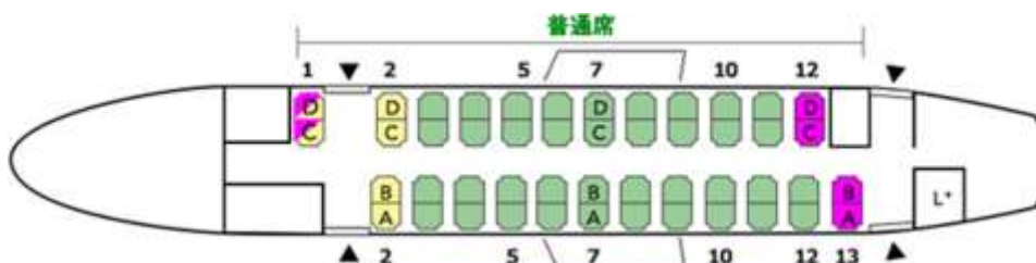
シートレイアウト