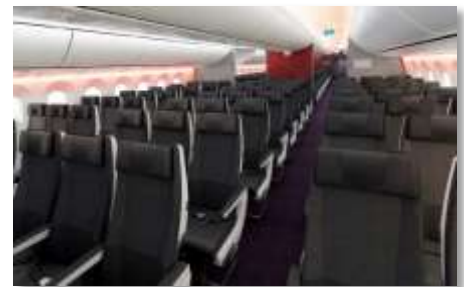
客室インテリア(イメージ)