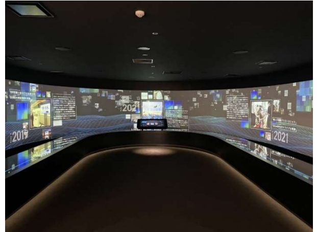
フューチャーゾーン