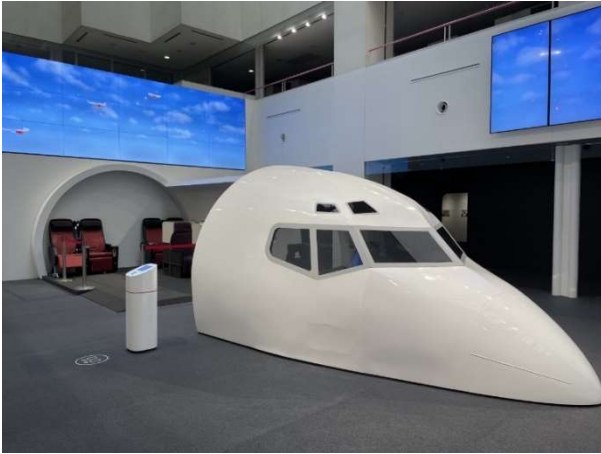
コックピット・客室モックアップ