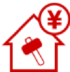
リフォームローン