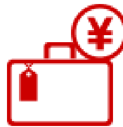
旅行ローンなど (多目的ローン)