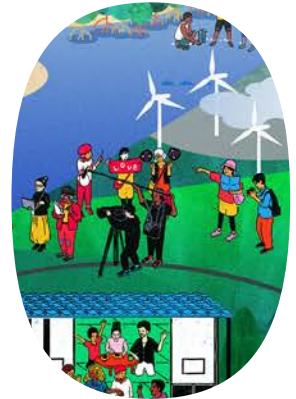
聖地巡礼型アニメ開発