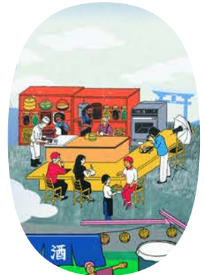
郷土料理継承ラボ