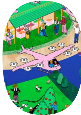
空の駅&離島空飛ぶクルマ

あらゆる地域で関係・つながりを増やし、 多くの人々やさまざまな物が自由に行き交う、 心はずむ社会・未来を実現するために。 JALはその翼をさらに大きく広げていきます。