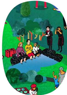
JALローカルメディア編集部