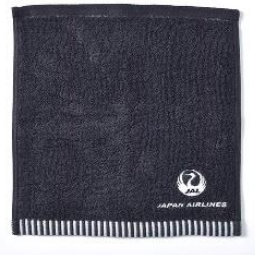
JAL オリジナル商品イメージ

JAL は、約 3,000 万人の顧客基盤を活用した非航空事業領域の拡大に向け、「マイルとともに、毎日の暮らしと人生をもっと豊かに」をテーマに日常生活やライフステージにおける多様なサービスを提供する「JAL マイルライフ構想」を推進しています。