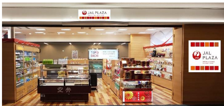
JAL PLAZA 店舗イメージ

なお、新店舗名称「JAL PLAZA」へのデザイン変更は、10月1日(日)からの羽田空港内の13店舗(軽食・レストラン店舗含む)を皮切りに、以降12月末までに全国の店舗で完了する予定です。