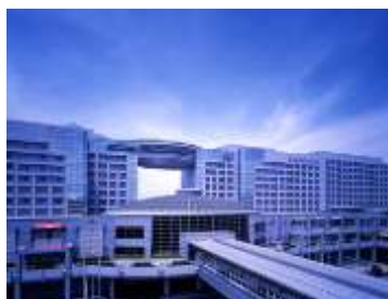
「ホテル日航関西空港」外観

6月24日に開業25周年を迎え、これからも地元のみなさまをはじめ、多くの方々とのつながりを大切に、そのつながりや感謝の思いを忘れずに、安心、安全、確実を追求し、地元のみなさまから喜ばれ、世界中のお客さまをお迎えできるホテルであり続けます。