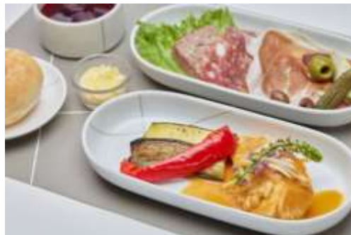
「機内食メニュー(上旬 羽田着、中旬 羽田発)」