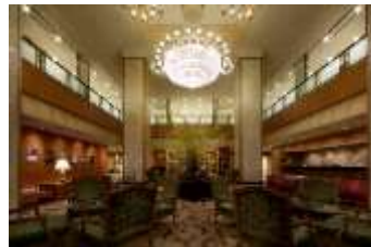
「ホテルアゴーラリージェンシー大阪堺」ロビー