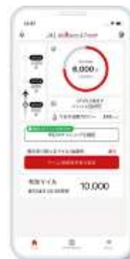
「JAL Wellness & Travel」アプリトップ画面

URL: https://www.jal.co.jp/jp/ja/jmb/wellness/