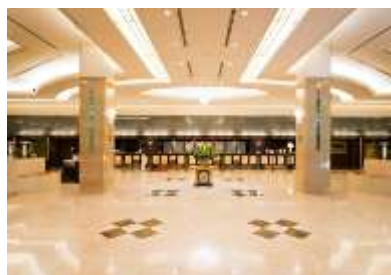
「ホテル日航関西空港」ロビー