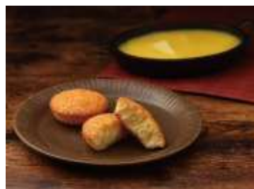
「こがしバターケーキ」