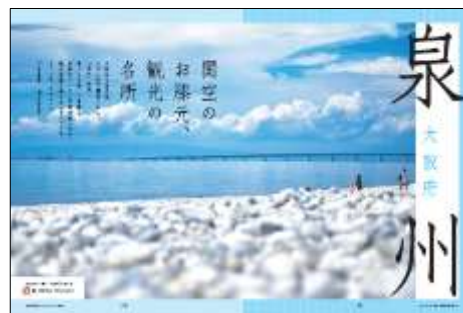
日本語特集記事(イメージ)