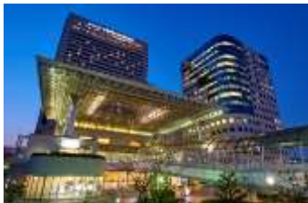
「ホテルアゴーラリージェンシー大阪堺」外観

ホテルコンセプトは、「Elegant & Noble たしなみごころを満たすアーバンホテル」。真の上質を知る成熟した大人のお客さまへ、ライススタイル全般を通してご満足いただけるホテルです。観光やビジネスはもちろん、近隣にお住まいのお客さまがご家族やご友人・同僚と集うパーティーや冠婚葬祭など、フルサービスホテルとしてワンランク上の価値をご提供します。アゴーラの旗艦シップホテルならではの「上質な本格」にこだわり、歴史ある都市 堺の迎賓館にふさわしい高貴なおもてなしと優雅な空間で、大切なひとときを紡ぎます。