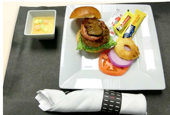
ファーストクラス・ビジネスクラス洋食