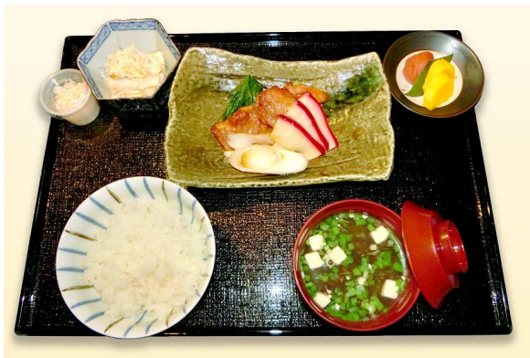
ファーストクラス・ビジネスクラス和食

JALは、これまでにご利用いただいたすべてのお客さまに感謝するとともに、これからの50年も「世界で一番選ばれ、愛される航空会社」を目指し、最高のサービスを提供してまいります。