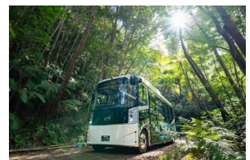
やんばるの森ネイチャーガイドツアー

当ツアーでは、希少な自然が多く残されたやんばる地域でのネイチャーガイドツアー、ビーチクリーン活動など、地域の皆さまと交流し、地域を守るオプションプランをご用意。人が交わることで地域活性化につながる取り組みに参加いただくことで、旅の魅力を改めて体感いただけます。