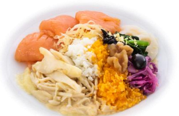
サステナブルな機内食

本チャーターフライトでは、環境負荷や栄養にこだわった未来の食材を使用した機内食や認証を取得した飲料のご提供、整備士が航空機廃材を利用して製作したバゲージタグの記念品をお渡し予定。また、沖縄でのオプションプランなど、サステナブルな取り組みにご協力いただいた方には、「サステナブルマイル」を付与します。一部の賛同いただいた宿泊ホテルでは、沖縄県の食材を生かした夕食オプションプランをご用意いただくほか、本チャーターフライトにご参加いただく企業とのコラボレーション企画なども予定しています。