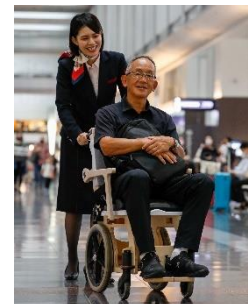
ストレスフリーな空の旅

本チャーターフライトでは、アクセシビリティ関連社内資格を取得した客室乗務員を機内に、またサービス介助者を空港にそれぞれ配置。音声文字化アプリを活用するなど、多様なお客さまをさまざまなバックグラウンドを持った乗務員・空港スタッフがお迎えします。