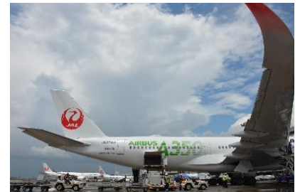
エアバスA350型機での運航

また、ご搭乗いただくお客さまには、手荷物軽量化によるCO2排出量の削減、機内での紙コップリサイクルなど、JALと共に環境負荷を減らす取り組みにご協力いただきます。