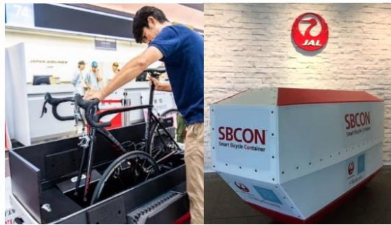
JAL 所有自転車輸送専用コンテナ 「SBCON® ※1 」