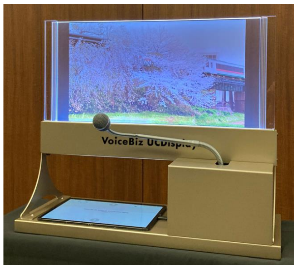
「VoiceBiz® UCDisplay®」イメージ (左:空港カウンター設置イメージ、右:ディスプレイカラー化のイメージ)