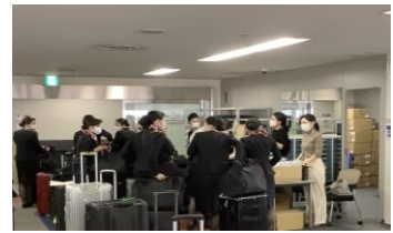
乗務員へのサンプリングの様子