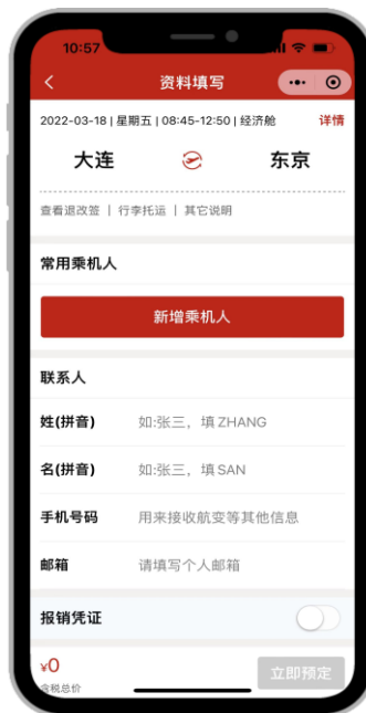
予約情報入力画面