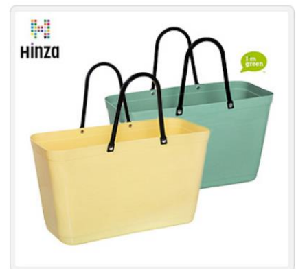
HINZAマルチバッグL 2Pセット(レモン&オリーブ) バイオプラスチック製