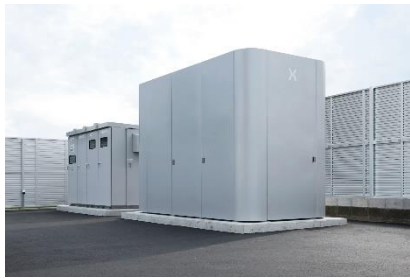
パワーエックスのHypercharger