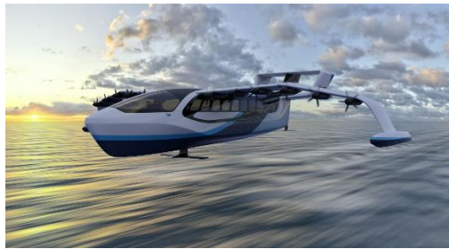
REGENT Craftのシーグライダー