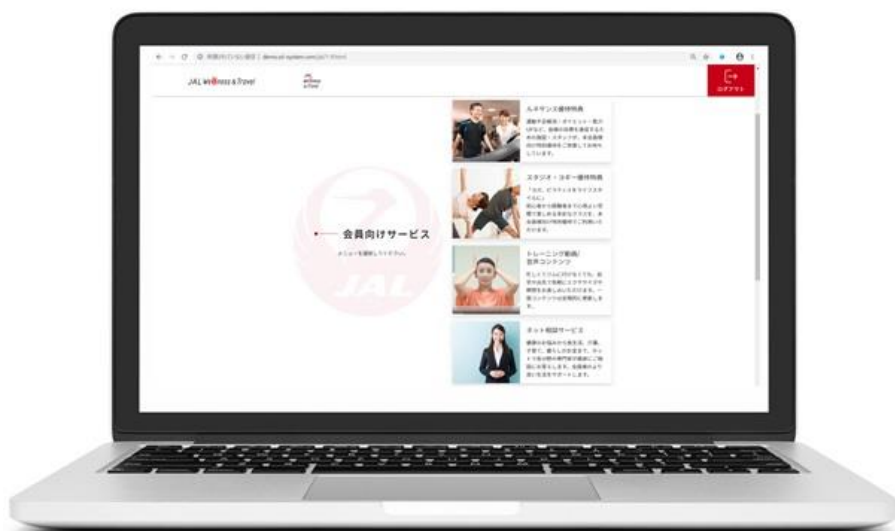
※会員専用マイページイメージです。

JALとDNPは今後も、顧客の健康に対するニーズにお応えするさまざまなサービスの提供を目指していきます。また「JAL Wellness & Travel」を通じて、JALの「観光振興」と「地域産業支援」を目的とした「新 JAPAN PROJECT」やDNPが各地で行っている地域創生の取り組みと、チェックインスポットとの連動などによりさらなる地域活性化を目指します。