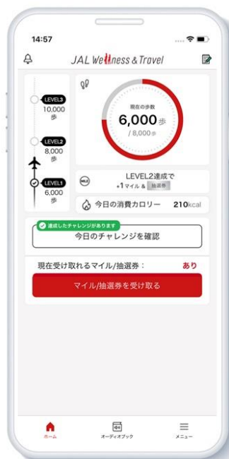
※スマホアプリのホーム画面イメージです。

近年、生活者の健康志向が高まっていることや、新しい生活様式におけるテレワーク拡大などにより運動不足が懸念されるなか、JALとDNPは「健康」と「旅」に焦点をあて、日常の健康と旅行前・旅行中のウェルネス活動をサポートする、新たなマイレージサービスを提供します。JALが持つ顧客基盤や路線ネットワークと、DNPが持つ会員管理システムや顧客体験を豊かにするさまざまなサービスやソリューションを組み合わせ、日常生活でマイルと健康が手に入り、次の旅へとつながるサービスを創出していきます。