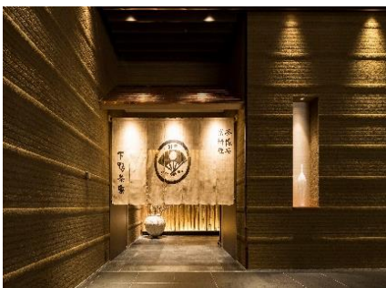
「ポルトムインターナショナル北海道 京都 下鴨茶寮 北のはなれ」