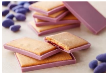
「北の散歩道 ハスカップ」