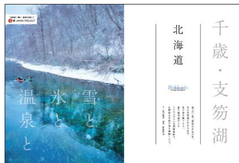
日本語特集記事(イメージ)