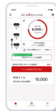
「JAL Wellness & Travel」アプリトップ画面

URL: https://www.jal.co.jp/jp/ja/jmb/wellness/