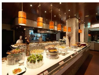
ヘルシービュッフェ「アマム」(イメージ)