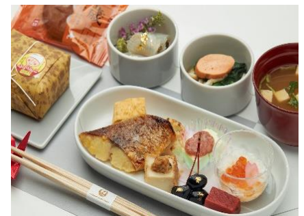
機内食メニュー(上旬 羽田発・下旬 羽田着)