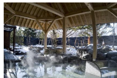
冬の露天風呂(イメージ)