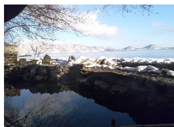
冬の露天風呂 (イメージ)