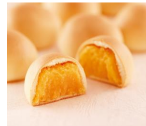
「千歳うまれのたまごまんじゅう」