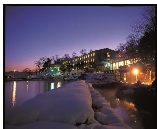
「丸駒温泉旅館」外観

支笏湖にある大正4年創業の一軒宿。天然露天風呂は支笏湖と繋がっており、湖面と湯面の高さが同じという特色があります。野趣あふれる露天風呂で支笏湖を肌で感じてください。