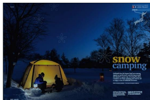
英語特集記事(イメージ)