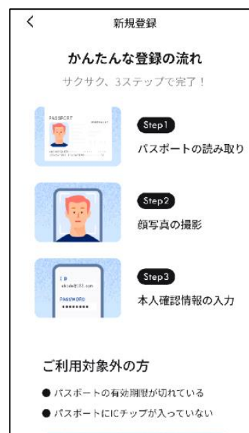
モバイルアプリ画面