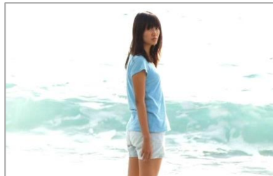
2012 年グランプリ『くじらのまち』 (鶴岡慧子監督)