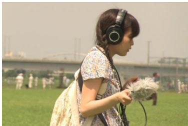
2014 年グランプリ『ナイアガラ』 (早川千絵監督)