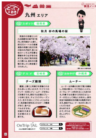
アンバサダーコラム