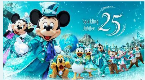
「東京ディズニーシー25周年 “スパークリング・ジュビリー”

https://www.tokyodisneyresort.jp/treasure/tds25th/