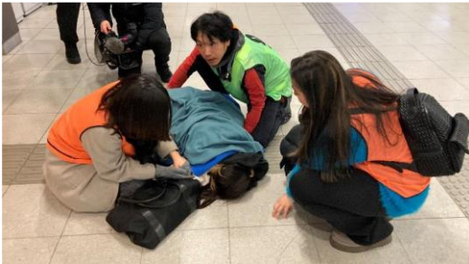
ロビーでの演習の様子

<演習イメージ> ※JALと慶應義塾大学がタイアップして他空港で実施した地震津波防災演習の様子